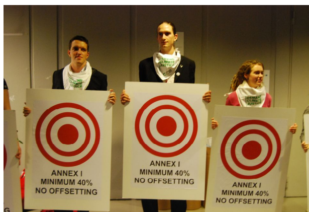
Les Amis de la Terre

Au final, les modalités de poursuite de la discussion ont abouti à une suspension de séance. Les ONG ont exprimé leur soutien à la proposition d'un accord juridiquement contraignant... Les négociations doivent reprendre et poursuivent aujourd'hui. A suivre.